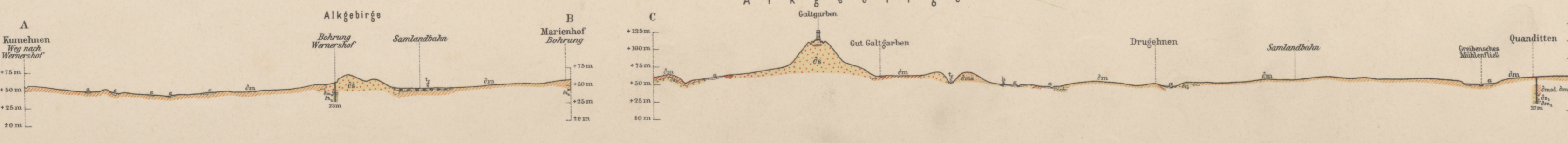
Profil C-D durch das Alkgebirge (Galtgarben) über Drugehnen nach Quanditten