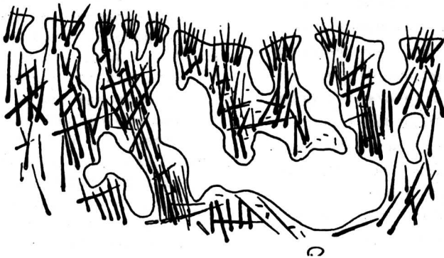
Abb.2: Skleren-Arrangement der Dermalzonen von Suberites domuncula . (verändert nach WIEDENMAYER 1977)