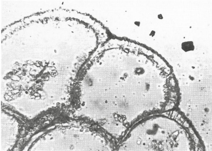
Abb. 2: Nonionoides demens . Vergrößerter Ausschnitt von Abb. 1. An der Gehäuseperipherie sind keine suturalen Kanäle ausgebildet, wie es für elphidiide Foraminiferen typisch wäre. 500 ×.

Die evolute Anordnung der Kammern, was als ein sehr aberrantes Merkmal innerhalb der Polystomellidae zu werten ist, spricht gegen eine Zuordnung zur Gattung Nonion , da hier alle bekannten Formen eindeutig involut sind. Deshalb erscheint es dem Autor angebracht, die Art in eine eigene Gattung zu stellen.