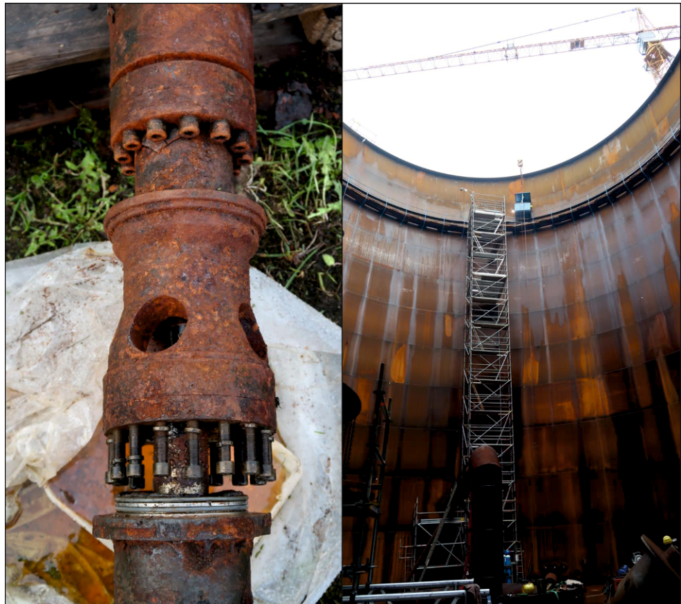
Fig. 4 Left: Corroded well pump of the cold well of the HT-ATES in Neubrandenburg. Right: New artificial storage tank to balance the short-term supply-demand mismatch (Fleuchaus et al. 2020a)

die Kälteversorgung nachhaltig demonstriert werden. Als erster über mehrere Jahre betriebener ATES in Deutschland überhaupt machte das System in Berlin auf die Technologie aufmerksam und dient auch weiterhin als prominentes Anschauungsbeispiel für potenzielle Nachahmer.