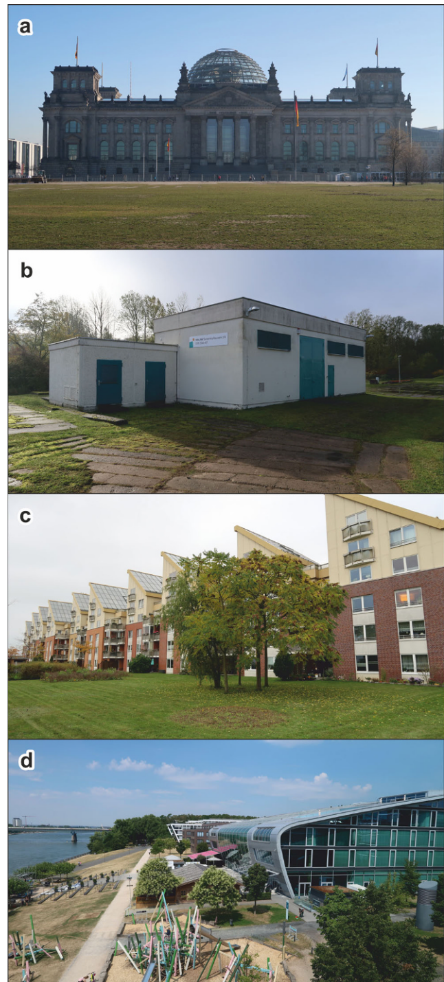
Abb. 3 Fotos realisierter Aquiferspeicherprojekte in Deutschland. a ATES Regierungsgebäude Berlin (© Schüppler); b HT-ATES Neubrandenburg (© Fleuchaus); c HT-ATES Rostock-Brinckmanshöhe (© Fleuchaus); d NT-ATES „Bonner Bogen“ (© Fleuchaus)

Der Aquifer für die Wärmespeicherung befindet sich in einer Tiefe von ca. 320 m und ist über eine Brunnendublette erschlossen. Bei überschüssiger Abwärme der betriebenen Blockheizkraftwerke wird der Speicher mit Temperaturen von ca. 70 °C beladen (Seibt und Kabus 2006). Wiedergewinnungsraten von knapp 80 % ermöglichen Fördertemperaturen von bis zu 65 °C zu Beginn der Heizperiode (Sanner et al. 2005; Sanner und Knoblich 2004). Allerdings wird die entstehende Abwärme in der Praxis überwiegend für die Absorptionskältemaschinen im Sommer verwendet, sodass der Speicher nur eingeschränkt beladen werden kann. Hinzu kommen aktuell Leckageprobleme in der horizontalen Anbindung, sowie starker Verschleiß der Brunnenpumpen. Dadurch ist der Speicherbetrieb für die Gebäudebeheizung vorläufig stillgelegt. Dennoch konnte ein erfolgreicher Speicherbetrieb sowohl für die Wärme- als auch für