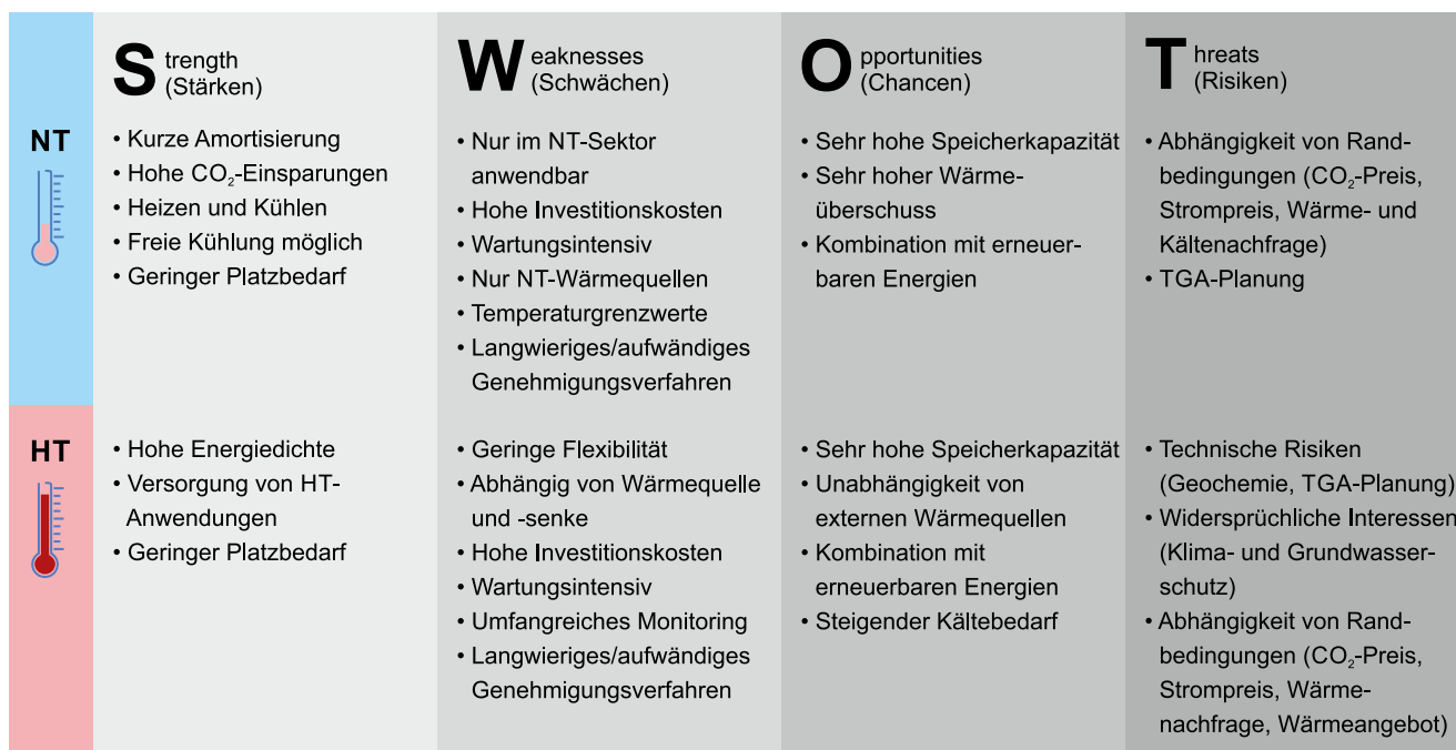
Abb. 5 Übersicht der SWOT-Analyse für Aquiferspeicher in Deutschland Fig. 5 Overview of the SWOT-analysis of ATES application in Germany