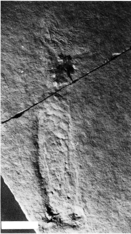
Abb. 1. Belemnoteuthis mayri ENGESER & REITNER, 1981, Unter- tithonium von Wintershof, Steinbruch Schöpfung, Ju- ra-Museum Willibaldsburg, Nr. SOS 1507. Maßstab = 2 cm.