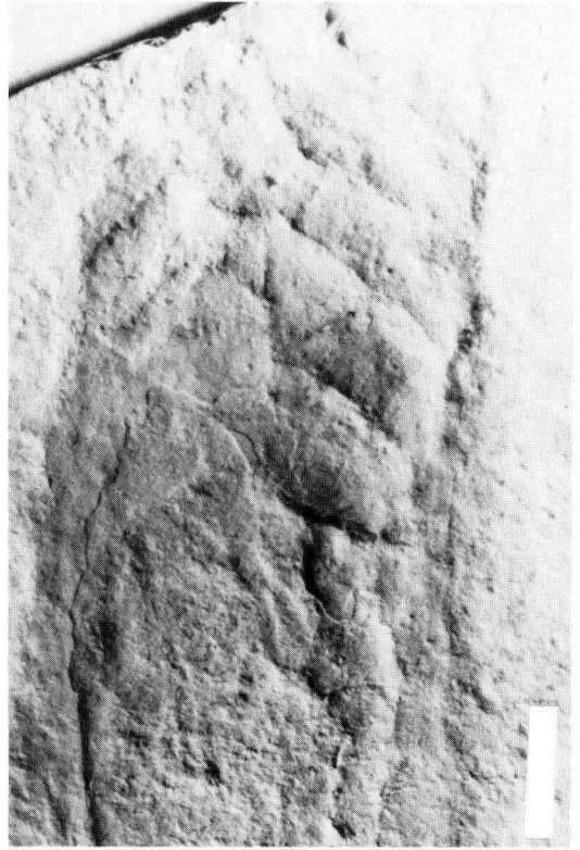
Abb. 2. Detail aus dem Bereich des Proostrakums. Die Run- zeln zeichnen die Anwachsstreifung nach. Die Mit- tellinie ist andeutungsweise zu sehen. Maßstab = 0,5 cm.

repräsentiert. Es ließen sich bisher keine nur ihnen gemeinsamen Apomorphien finden. Die bisher für die Charakterisierung dieser Taxa benutzten Merkmale, z. B. Hähchenform, Proostrakum-Form und das aragonitische Rostrum, sind eindeutig plesiomorphe Merkmale (ENGESER, 1990). Die als Apomorphie angesehene napfförmige Anfangskammer der Ordnung »Belemnoteuthida« beruhte auf einer Fehlinterpretation einer diagenetisch veränderten belemnitischen Anfangskammer (MAKOWSKI, 1952). Die erste Kammer von Belemnoteuthis polonica MAKOWSKI, 1952 ist belemnoid (oval-eiförmig mit einer Closing-Membran) (BANDEL & KULICKI, 1988). Das Taxon Belemnoteuthida wird daher aufgegeben (vgl. auch ENGESER, 1990). Die von ENGESER & REITNER (1981) ebenfalls zur Ordnung Belemnoteuthida gestellte Gattung Chondroteuthis besitzt eine oval-eiförmige erste Kammer und deutlich verschiedene Hähchen. Sie hat mit den Taxa Acanthoteuthis und Belemnoteuthis nichts gemein (ENGESER & REITNER, im Druck). Die Familie Belemnoteuthididae wird als paraphyletische Gruppierung zunächst akzeptiert, bis entweder die Monophylie oder Polyphylie dieser Gruppe nachgewiesen werden kann.