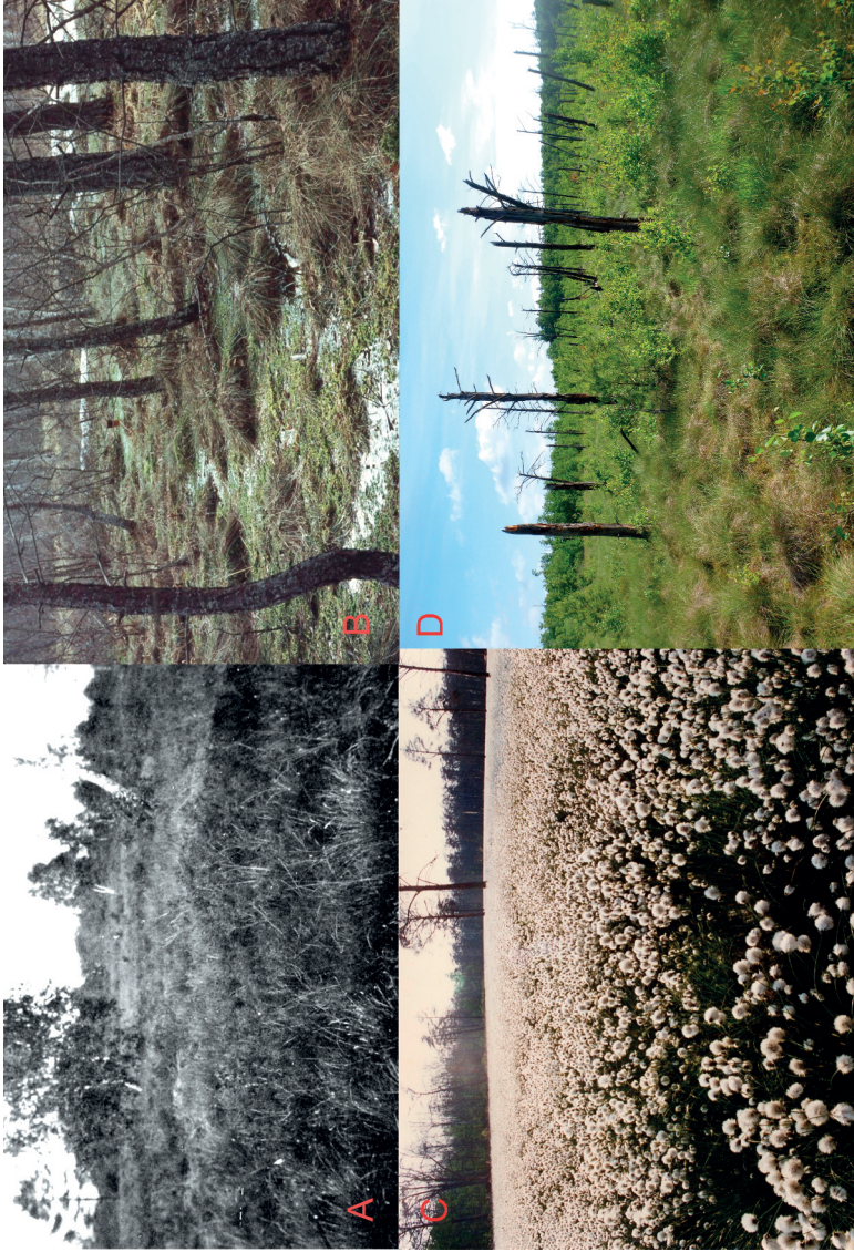
Abb. 1: Das Zentrum des Großen Kieshofer Moores in einer Zeitreihe. A: Verheidetes, aber noch halb-offenes Moor in den 1920er Jahren (Foto: Rabbow); B: Stark zugewachsenes Zentrum im Jahr 1972 (Foto: Jeschke); C: Regeneration von Eriophorum vaginatum im Jahr 1994 nach Absenkung des Überstaus von 1992 (Foto: Jeschke); D: Erneuter Betula - und Pinus -Aufwuchs im Jahr 2013 nach erneuter Entwässerung (Foto: Michaelis).

The centre of the mire „Kieshofer Moor“ in a time series. A: Mire centre overgrown by dwarf-shrubs in the 1920 (photo: Rabbow); B: Densely forested centre in 1972 (photo: Jeschke); C: Regeneration of Eriophorum vaginatum in 1994 after lowering of the inundation in the year 1992 (photo: Jeschke); D: New Betula and Pinus development in 2013 after new drainage (photo: Michaelis)