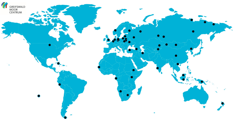
Abb. 3: Die Projektgebiete des GMC. Project areas of the GMC

Um die moorbezogenen Aktivitäten in Greifswald zu bündeln und zu verstetigen, wurde von den drei Partnern Universität Greifswald, Michael Succow Stiftung und DUENE e.V. im Januar 2015 das Greifswald Moor Centrum (GMC) gegründet. Auf Basis der Kompetenz von 50 Moorkundlern am Standort Greifswald arbeitet das GMC an der Schnittstelle zwischen Wissenschaft, Politik und Praxis, lokal und weltweit (Abb. 3).