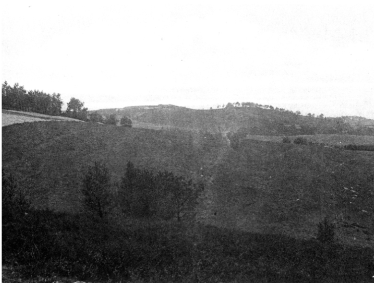
Endmoräne (südliche Außenmoräne) bei Geesthacht von SW gesehen.