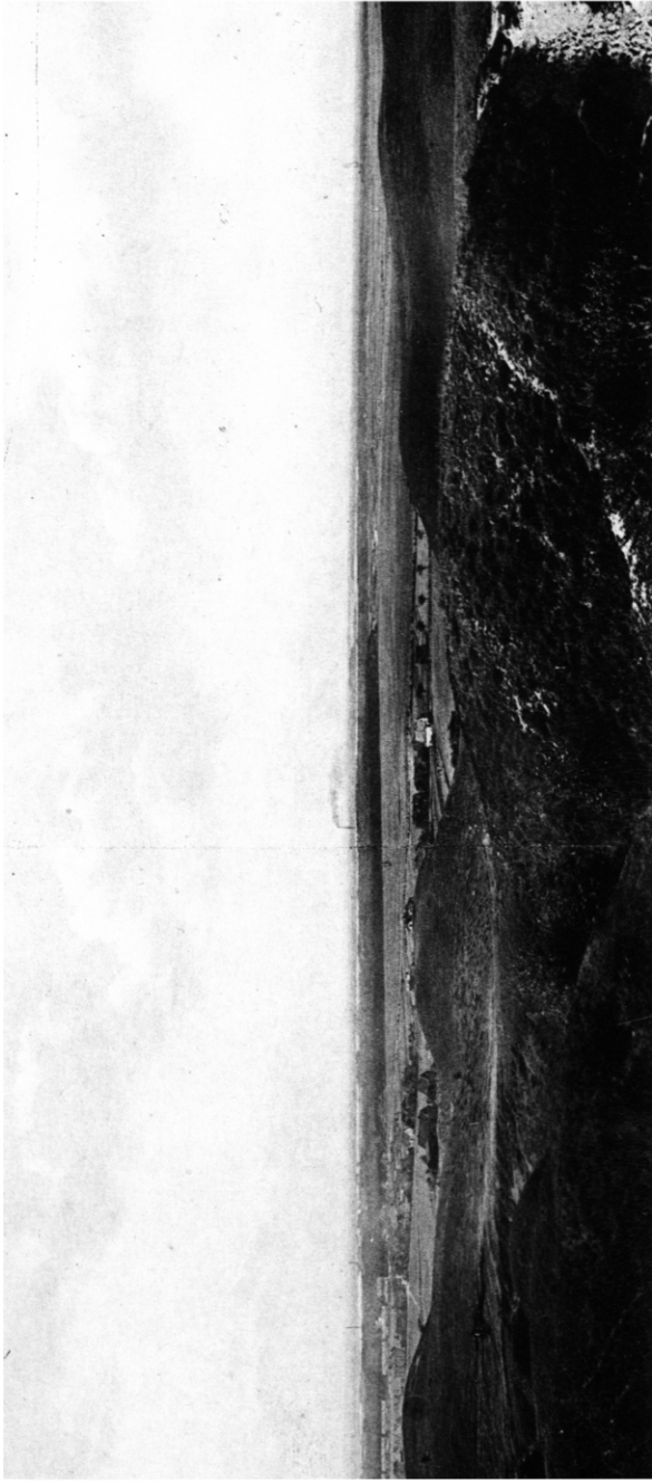
Abfall der südlichen Außenmoräne nach der Elbniederung bei Geesthacht (die Talsande im Hintergrund sind zu hohen Dünen zusammengeweht).