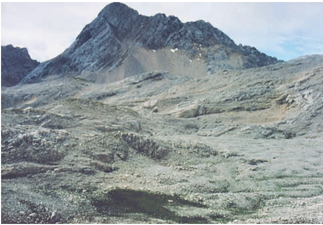
Abb. 2: Zugspitzplatt mit Schneefernerkopf (im Westen), im Vordergrund die untersuchte Doline.

Fig. 2: The Zugspitzplatt with the Schneefernerkopf to the west; the doline investigated is in the foreground.