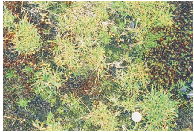
Abb. 3: Ausschnitt aus der Vegetationsdecke der untersuchten Doline. Der Durchmesser der Münze beträgt 2,5 cm.

Fig. 2: The Zugspitzplatt with the Schneefernerkopf to the west; the doline investigated is in the foreground.