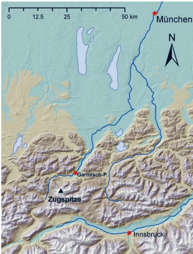
Abb. 1: Lage des Zugspitzplatts (W. HAGG).