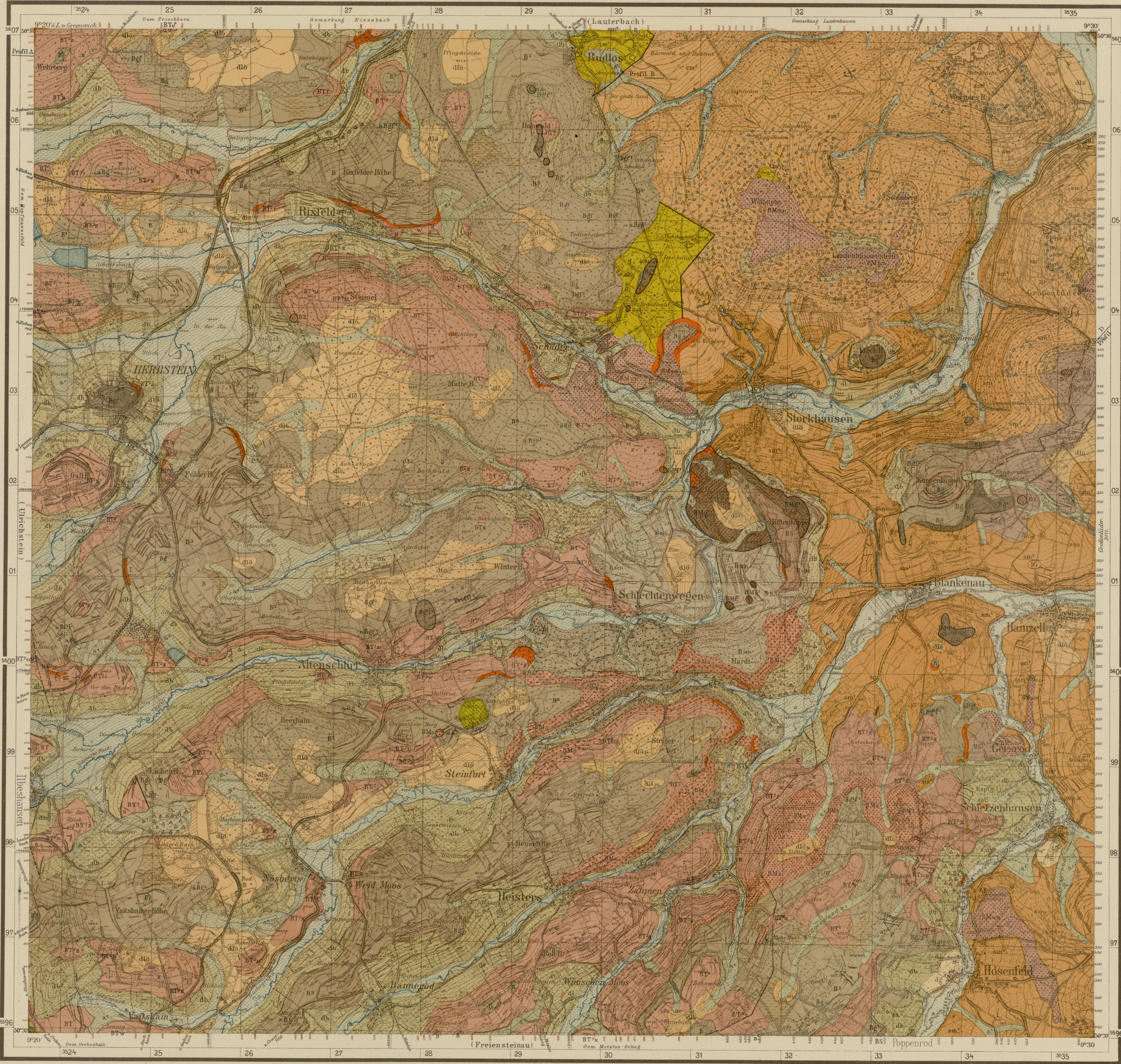
Lit. u. Druck vom Hess. Landesvermessungsamt 1928