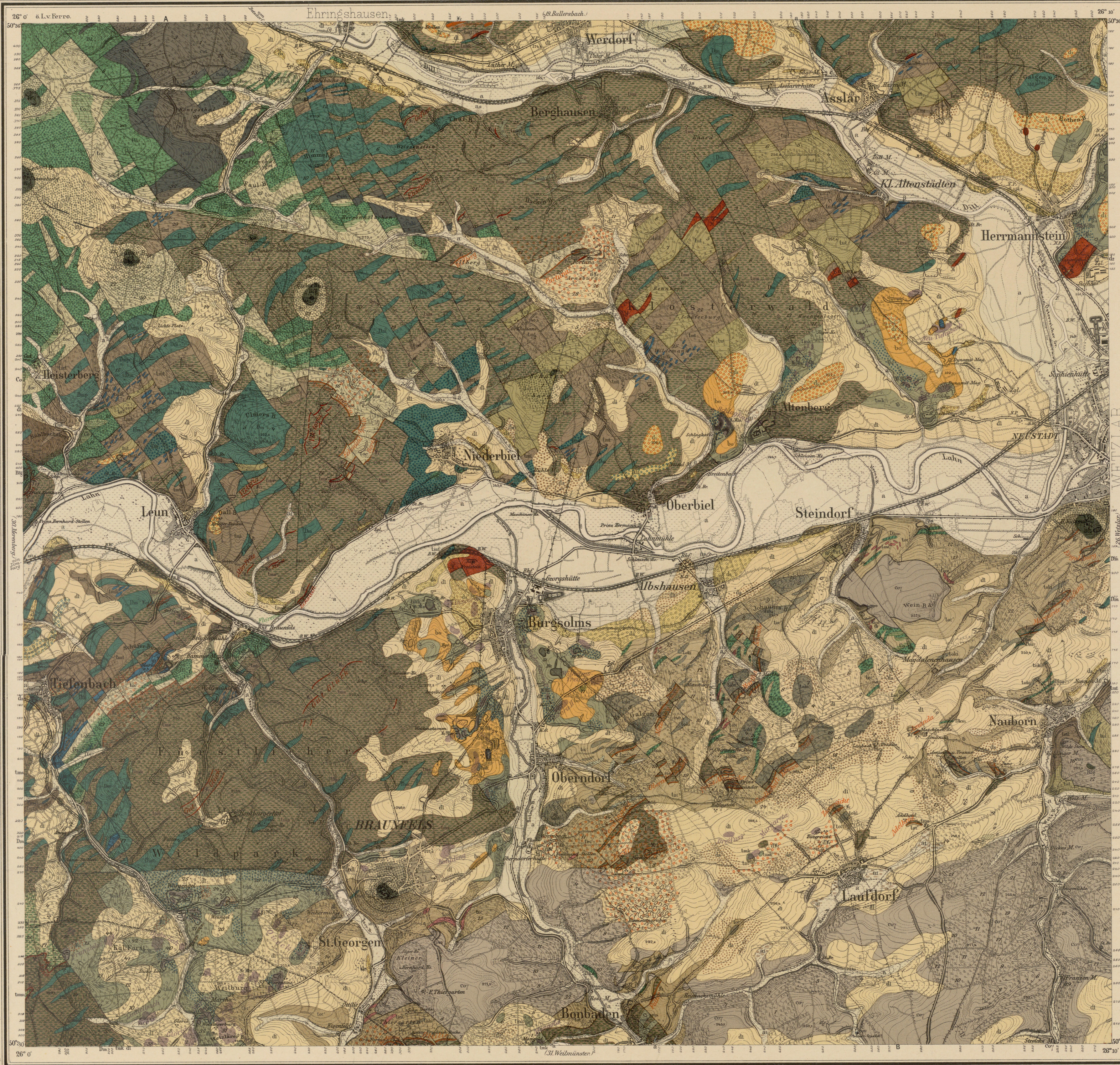
Topogr. Aufnahme des kgl. Preuß. Generalstabes 1892. Berichtigt 1911. Nachtrage bei der geol. Aufnahme.