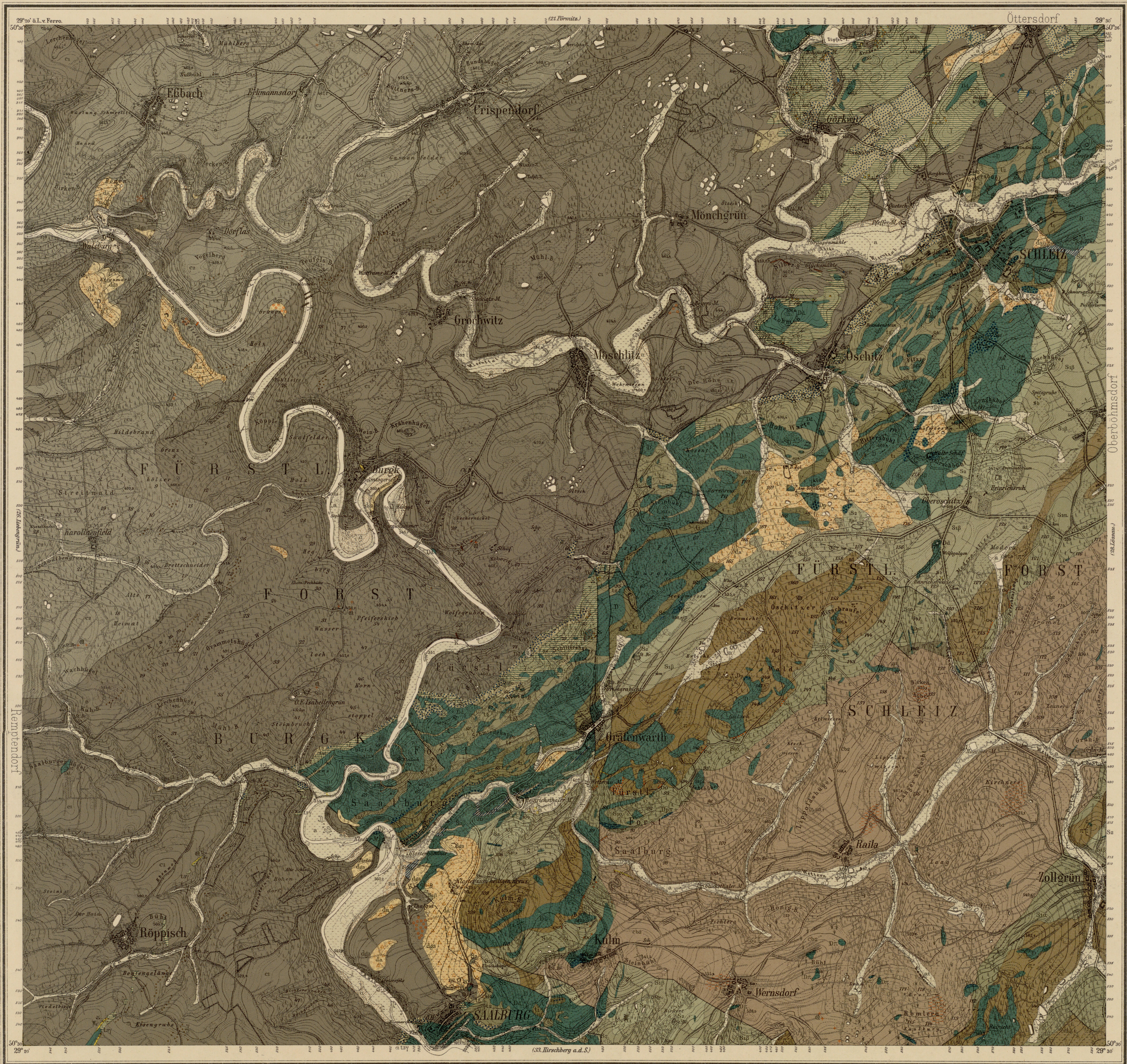
Topogr. Aufnahme des kgl. Preuß. Generalstabes 1907. Herausgegeben von der kgl. Preuß. Geol. Landesanstalt 1912. Lieferung 181.